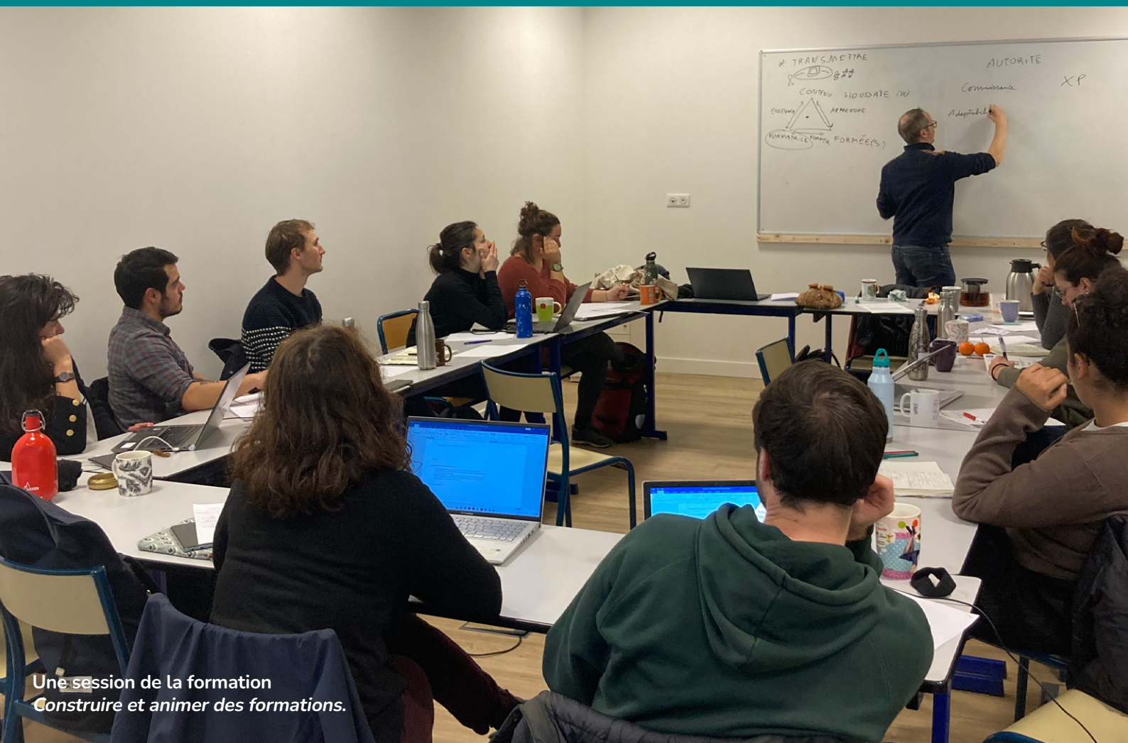
Une session de la formation Construire et animer des formations.

Accompagner la transition des organisations et des territoires avec Transition tout terrain